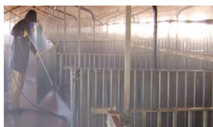
Дезінфекція приміщень де утримувались хворі свині.