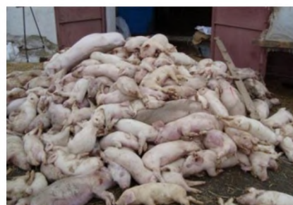
Загибель великої кількості свиней