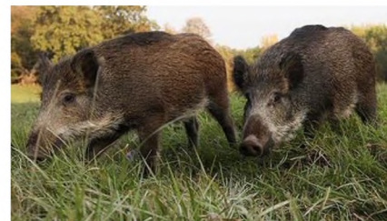
Європейський дикий кабан