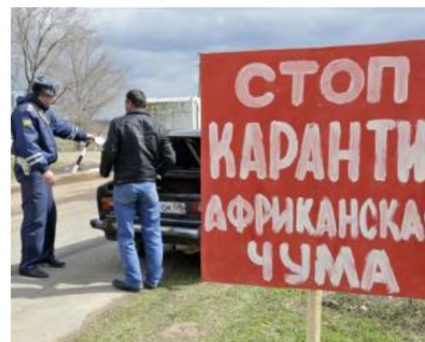
Обмеження на переміщення свиней та м'ясопродуктів в карантинній зоні.