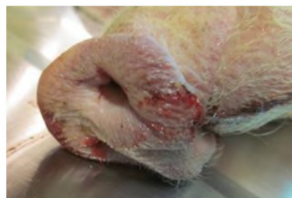
Крововиливи на слизовій п'ятачка