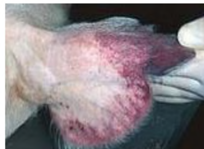
Крововиливи на шкірі вухних раковин