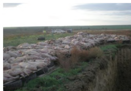
Утилізація трупів свиней.