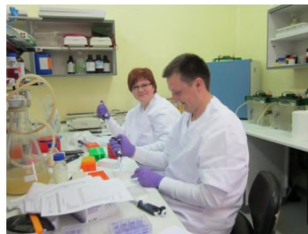
Діагностика АЧС в лабораторії.

При підозрі на АЧС сповістіть фахівця, краще перестраховатись, ніж наразити на небезпеку всіх сусідів !