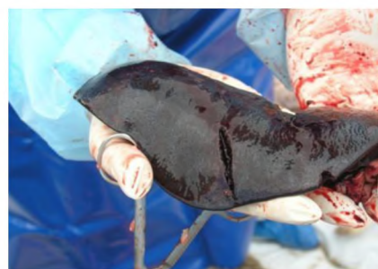
Збільшена в декілька разів селезінка свині при АЧС